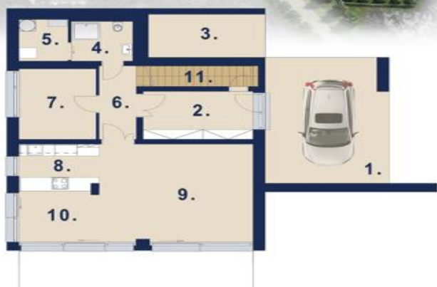
1. NADZEMNÍ PODLAŽÍ